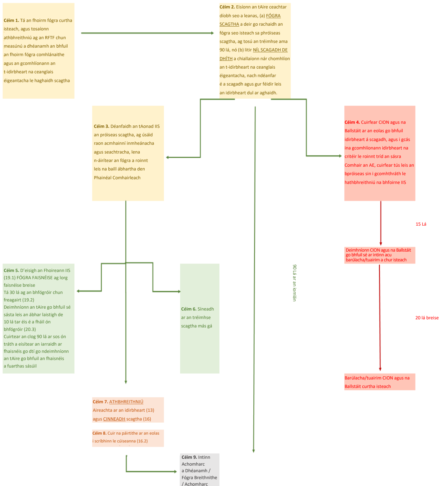
Figiúr 1: Amlínte don Phróiseas Scagtha